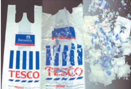
Degradación progresiva de una bolsa con tecnología TDPA® de EPI